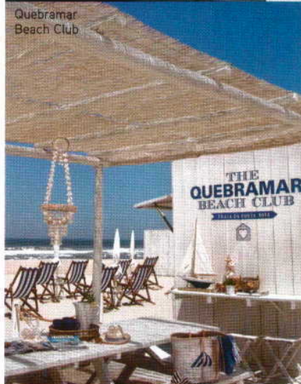
Quebramar Beach Club